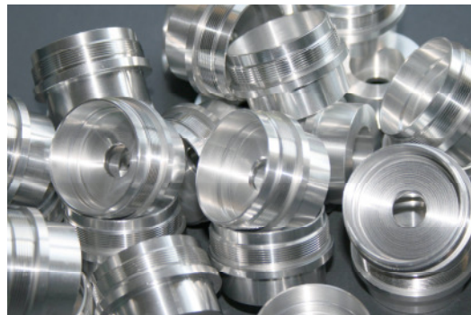
Präzision und Verarbeitung auf höchsten Niveau

Das daraus entstandene elitäre Produkt, wird auf der einen Seite durch seine raffinierte Verarbeitung und ausgeklügelten Technischen Lösungen und auf der anderen Seite durch die einfache Handhabung gekennzeichnet.