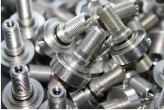
Einige der neuen Parts

Der Entstehung, der umfangreichen Tuning Maßnahmen der P40 , durch Pepi Innerhofer - B.S.C. GmbH und seinem Team, liegen Aufwändige Entwicklungsphasen, sowie die Produktion diverser CNC Spezialteile und Monatelange Tests auf Rennstrecken und Prüfbank zu Grunde.