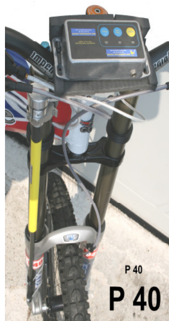
Nichts wird dem Zufall überlassen